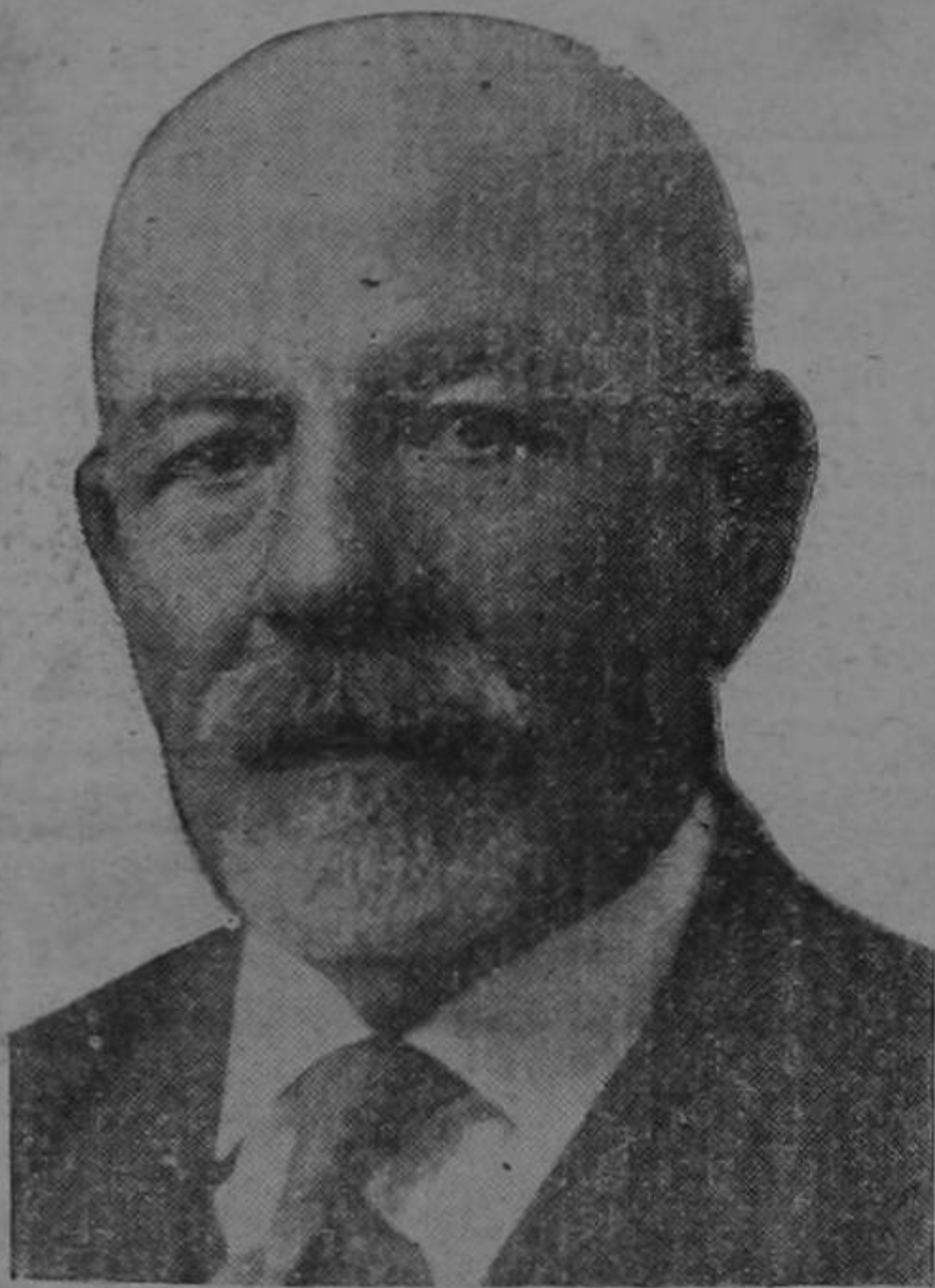
Lic. don CLETO GONZALEZ VIQUEZ

ILUSTRE EX-PRESIDENTE Y BENEMERITO DE LA REPUBLICA FALLECIO EN LA CIUDAD CAPITAL